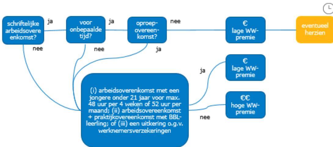
Figuur 1: hoge/lage WW-premie